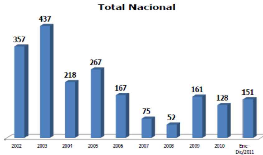
Tabla 1. Acciones de grupos armados al margen de la ley 2002 - 2011

Fuente: Logros de la Política Integral de Seguridad y Defensa para la Prosperidad. Ministerio de Defensa. Diciembre, 2011.