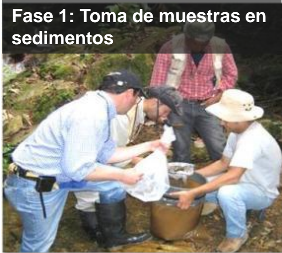
Fase 1: Toma de muestras en sedimentos