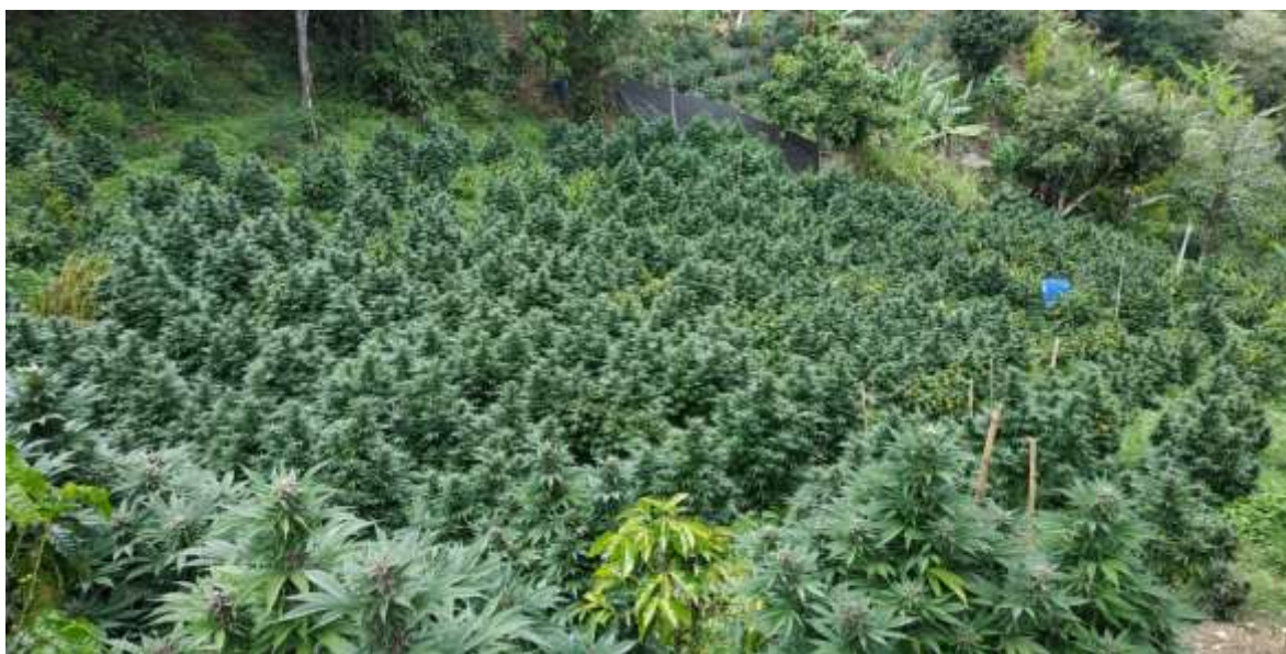
Cultivo de marihuana de la variedad conocida como ‘Morada’ en el municipio de Jambaló.

aparecido, “dinero que ha debido fluir para las comunidades, para los asociados se están quedando en las directivas y no se sabe que pasa con el dinero”, manifestó un asociado del municipio de Toribio. 59 Las inconformidades han surgido también por las formas autoritarias en que la dirección general del Gremio controla la asistencia a reuniones o la organización de jornadas de erradicación de matas de marihuana en municipios y cultivadores que han sembrado estas sin autorización de la organización. La cuestión es que desde la directiva general mandan a organizar a todas las personas y las obligan a movilizarse y cumplir lo que estas directivas soliciten, so pena de ser castigados levantándole matas de sus cultivos, lo que inmediatamente significa impactos económicos negativos para ese cultivador si no cumple con los llamados.