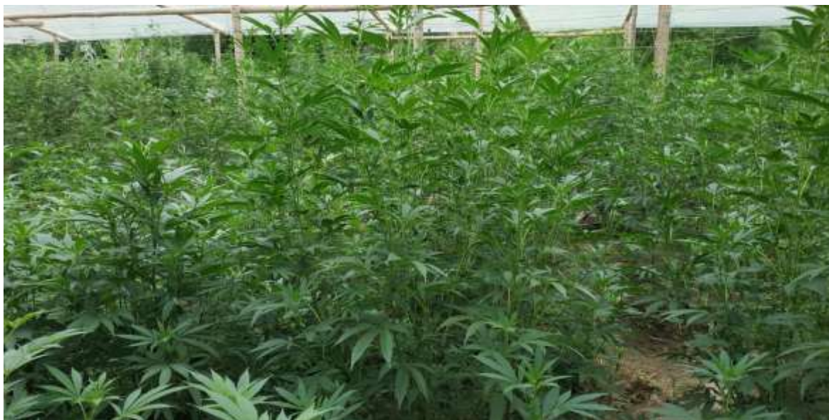
Cultivo de marihuana de especie exótica ‘Tangerine’ en invernadero en el municipio de Corinto.

un actor que cada vez le disputa más legitimidad y base social a los mayores y mayores, “el Gremio ha significado un remedo del ejercicio de la autoridad indígena, se agremiaron por veredas, se agremiaron por municipio, se agremiaron por región, hoy tienen hasta una agremiación del suroccidente colombiano”, contó un coordinador de la guardia indígena. 54