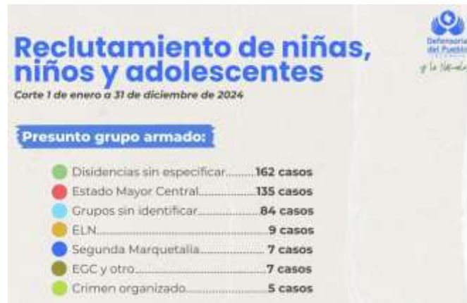
Imagen 3: Actor armado responsable de casos de reclutamiento de NNAJ, entre el 1 de enero al 31 de diciembre de 2024