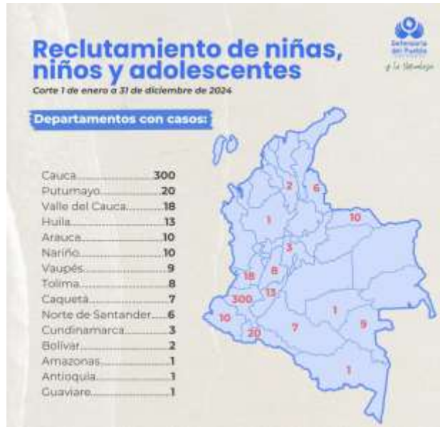
Fuente: Defensoría del Pueblo, 2025