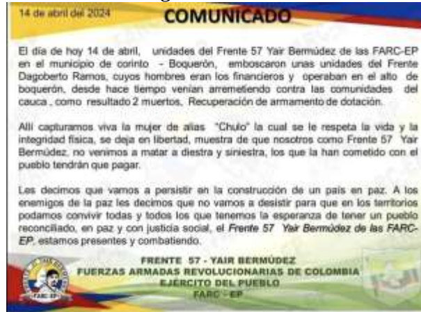
Imagen 2. Comunicado público del Frente 57 anunciando acción contra el Frente Dagoberto Ramos

La presencia del ELN también la destacó una autoridad indígena del resguardo de San Francisco en el municipio de Toribio de la siguiente manera: